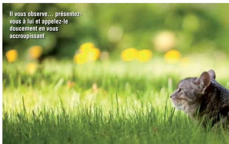
Il vous observe... présentez-vous à lui et appelez-le doucement en vous accroupissant

faut s'armer d'une grande patience et surtout avoir beaucoup de chance. De taille et d'aspect similaire à notre chat commun, il est marron tigré et sa queue est annelée de noir. Oubliez tout de suite une quelconque aventure avec ce félin, il vit exclusivement en liberté !