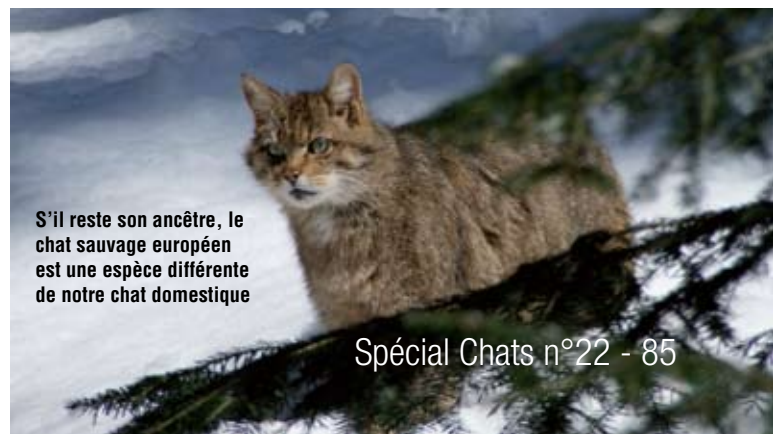
S'il reste son ancêtre, le chat sauvage européen est une espèce différente de notre chat domestique