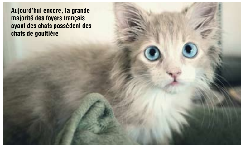
Aujourd'hui encore, la grande majorité des foyers français ayant des chats possèdent des chats de gouttière