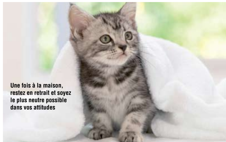
Une fois à la maison, restez en retrait et soyez le plus neutre possible dans vos attitudes