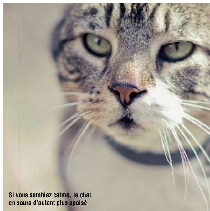
Si vous semblez calme, le chat en saura d'autant plus apaisé

Vous pourrez exceptionnellement observer un chat sauvage européen dans nos forêts vosgiennes ou alpines mais de par sa nature extrêmement craintive et discrète , il