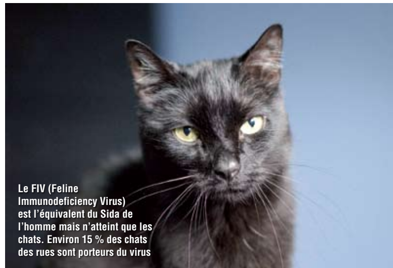
Le FIV (Feline Immunodeficiency Virus) est l'équivalent du Sida de l'homme mais n'atteint que les chats. Environ 15 % des chats des rues sont porteurs du virus

C'est dans ce genre de situation qu'il convient de ne rien faire, même si ce que vous voyez vous semble peu ami-